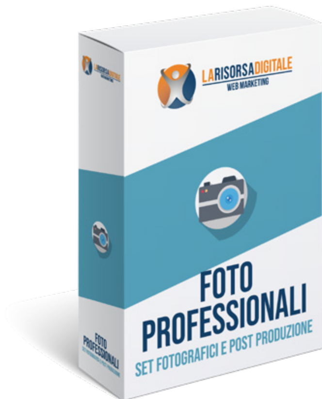
FOTO AZIENDA ISTITUZIONALI

Scattiamo e post-produciamo fotografie professionali perfette per siti web, e-commerce, volantini ecc.